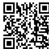
ZOOM Client iOS

Sobald der Client installiert ist und gestartet wurde, hat man die Möglichkeit sich mit einem Zoom-Konto anzumelden, oder als Gast an einem Meeting teilnehmen ( Es ist nicht notwendig einen Account zu erstellen um teilzunehmen! Zur Teilnahme auf „An Meeting teilnehmen“ klicken. Es öffnet sich ein Fenster mit zwei Textfeldern, in das erste trägt man die in der Mail angegebene Meeting-ID ein. In das zweite den / die eigenen (vollständigen) Namen , mit dem man in der Teilnehmerliste des Meetings angezeigt wird.